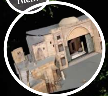
Neues Bühnenbild – das neue Jerusalem

Passion 2018: Gastlichkeit im Oberen Werntal